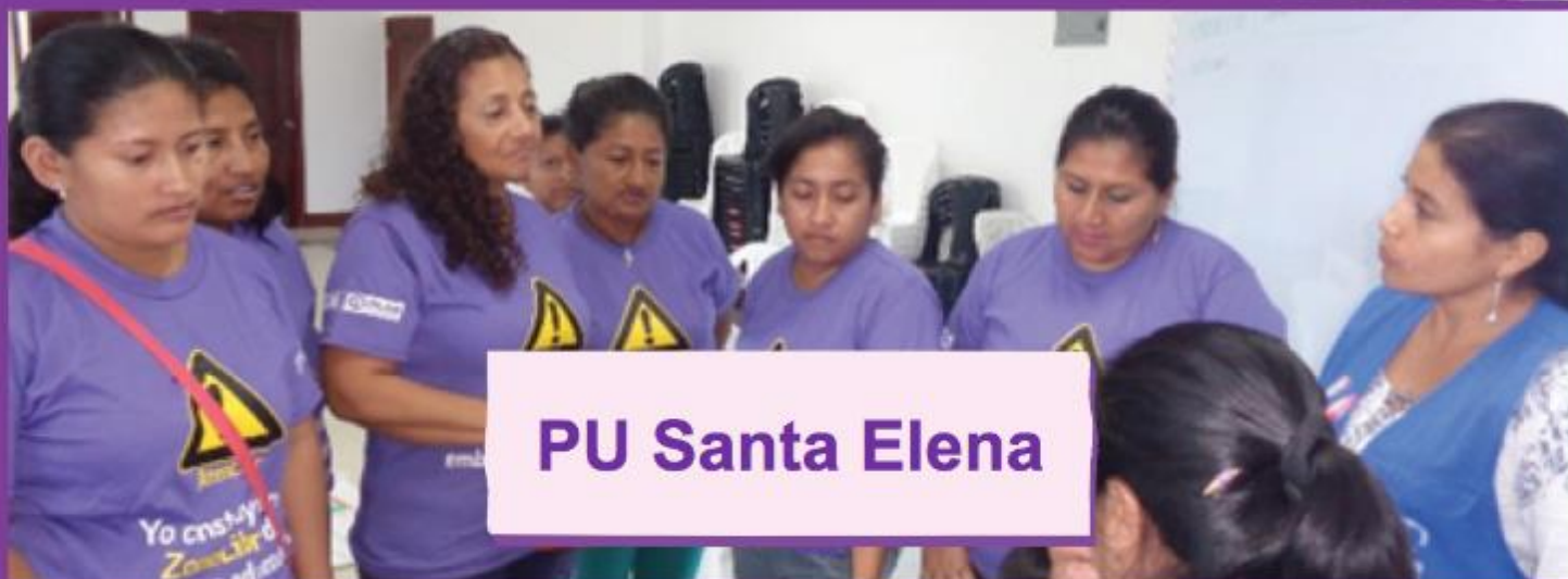
PU Santa Elena